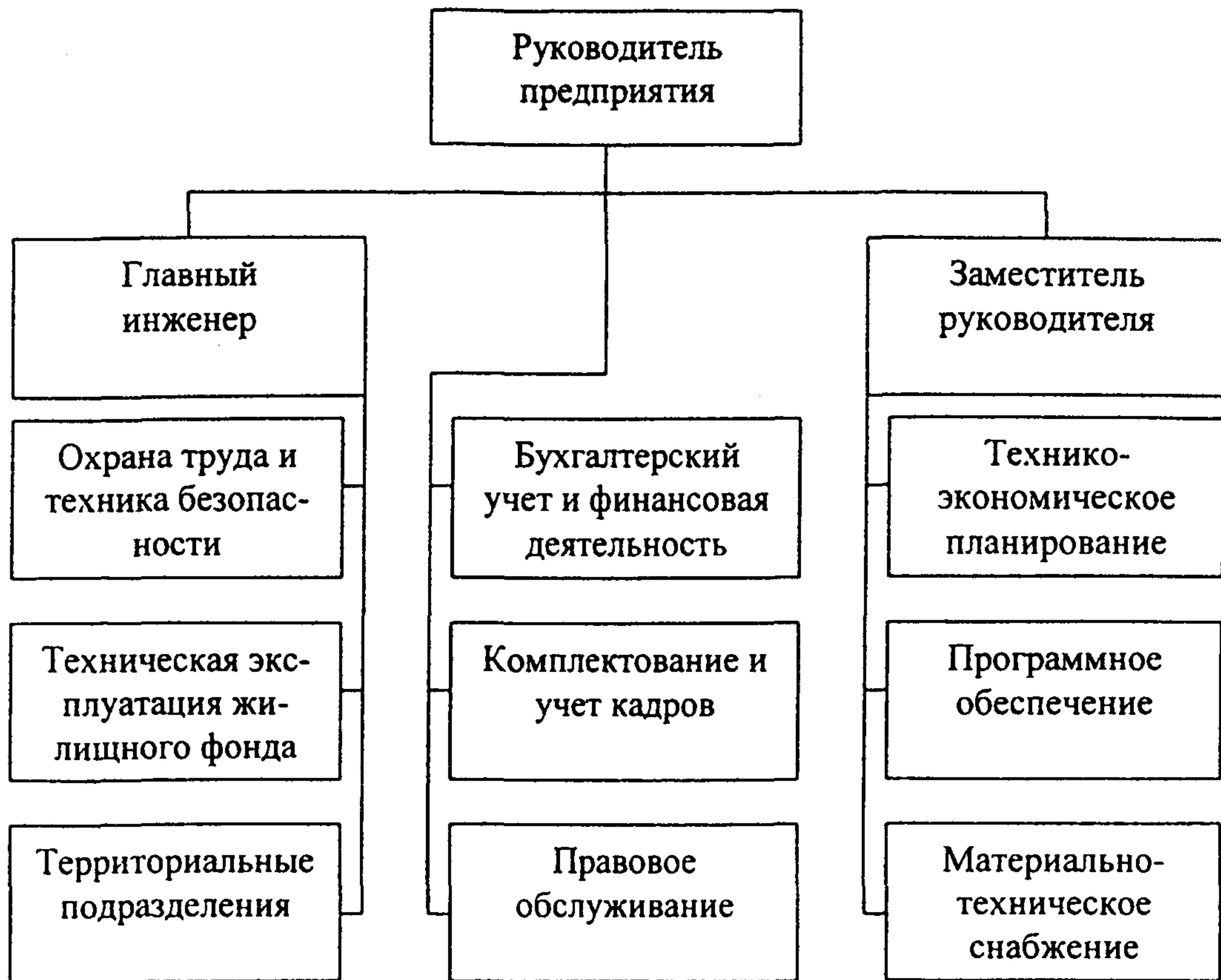
Примерная организационная структура муниципального предприятия-подрядчика